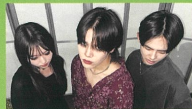
- 蝙蝠 - (コウモリ)