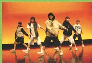
東京都立深沢高等学校