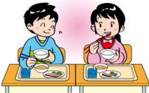
イラスト©少年写真新聞社 SeDoc