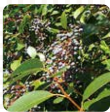
トウネズミモチの実