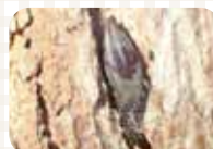
ヒシモンナガタマムシ