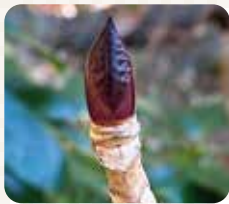
アジサイの冬芽にはカバーがないので葉のしわが良く見えます。