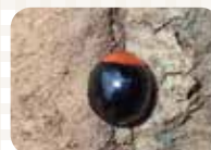
ムネアカオオクロテントウ