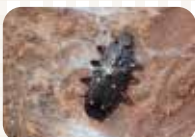
ヨツボシオオクスイ