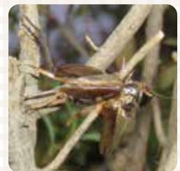
エンマコオロギの「はやにえ」

まわりの小さな木の枝に、 虫が刺さっています。 モズのしわざ「はやにえ」がありました。 なんで、こんなこと? 不思議ですね。