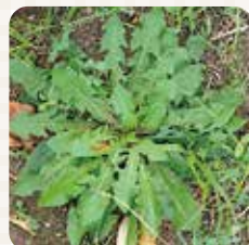
タンポポのロゼット