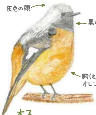
オス メスに比べると ちょっとカラフル

食べ物 昆虫やミミズ、ナンテン、ウメモドキ、 センリョウ、トウネズミモチ などの実を食べる