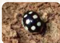
ウスキホシテントウ