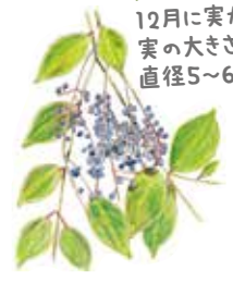
トウネズミモチ 12月に実が熟(じゅく)す 実の大きさは 直径5~6mm