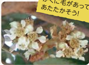
冬に咲くビワの花は鳥や虫たちにとって大事な蜜源(みつげん)

ビワの花が咲き、ヒヨドリやメジロが蜜(みつ)を吸いに来ていました。紫(むらさき)色に熟(じゆく)したトウネズミモチの実に、ヒヨドリが集まっていました。ベニバナミツマタの花が少し咲きはじめていました。アジサイやサンゴジュ、ガズミも冬芽をつけて春の準備(じゅんび)をしています。葉を落としたところをルーペで見ると、枝と葉で水や栄養(えいよう)のやりとりをしていた管(かん)のあとが、顔のように見えてきます。