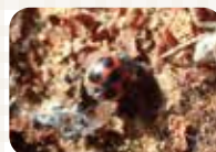
モンクチビルテントウ