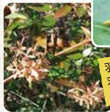
ハナツクバネウツギ(アペリア)の実