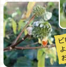
ベニバナミツマタ