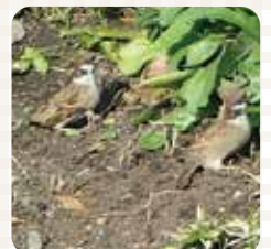
砂浴びをしていたスズメ達