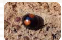
ヘリグロテントウノミハムシ