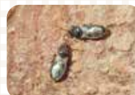
ヒメコバネナガカメムシ