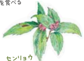
センリョウ 11月~1月に赤い実をつける 実の大きさは5~7mm