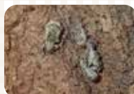
ヒレルクチブトゾウムシ