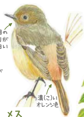
メス オスに比べると 色は地味(じみ)