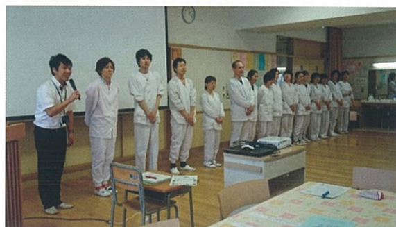
調理をしてくださっている