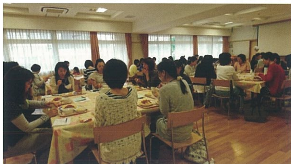
給食試食会の様子