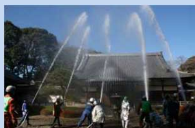
文化財防火デー消防演習

消防団は、学生・会社員・自営業者・主婦など様々な方が集まって活動しています。近年は女性の団員も増え、それぞれの得意分野を活かしながら活躍されています。皆さんも消防団に参加して、大切なまちをいっしょに守っていきませんか。