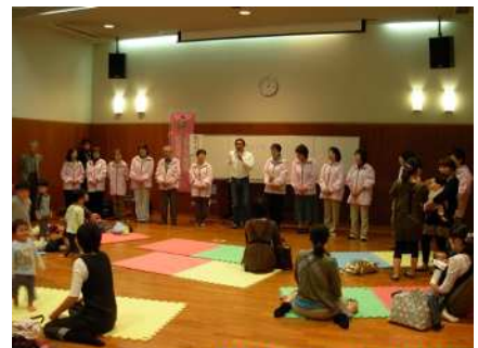
乳幼児安全ワンポイント講習