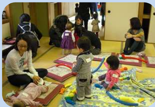
子育ての相談もしています