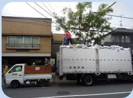
大きなトラックにいっぱい集まりました

イクル推進委員」という立場から「資源・環境」を考えて古着リサイクルをしたいと以前から思っていました。