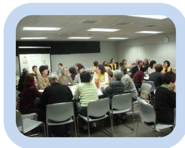
住民懇談会で熱心に話し合い