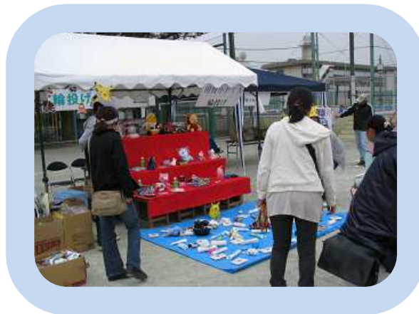
みんなで楽しく輪投げに挑戦