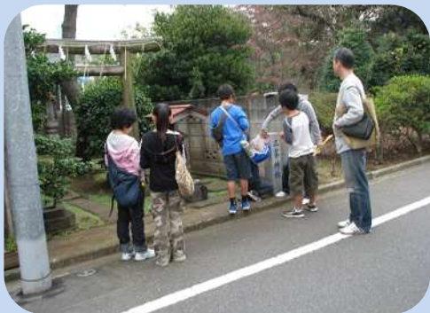
こんなところにも石標発見！

親子で石標を巡るラリーに参加しました。普段はただ通り過ぎていた身近な道で、石標を探しながらのんびり歩