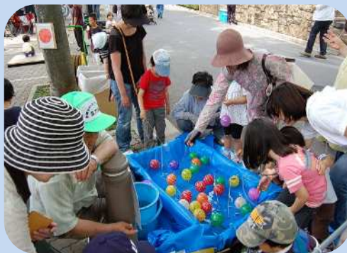
子どもも大人もヨーヨー釣りに夢中