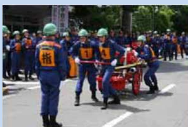
世田谷消防団消防操法大会