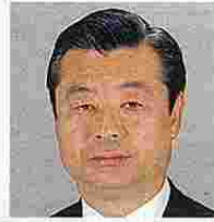
石塚一信(いしづかいっしん) (自由民主党)