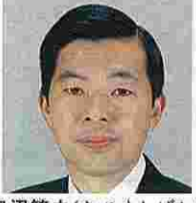
田沼繁夫(たぬましげお) (日本共産党)