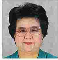
平塚信子(ひらつかのぶこ) (公明党)