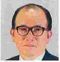
原田正幸(はらだまさゆき) (自由民主党)