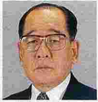
五十畑孝司(いそはたこうじ) (自由民主党)