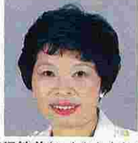
唐沢敏美(からさわとしみ) (日本社会党)