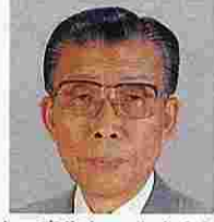
太田喜淑(おおたきよし) (自由民主党)