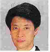
山内 彰(やまのうちのあきら) (自由民主党)