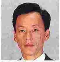
村田義則(むらたよしのり) (日本共産党)