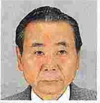
宮田玲人(みやたれいじん) (自由民主党)