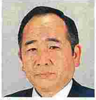
星谷知久平(ほしやちくへい) (自由民主党)