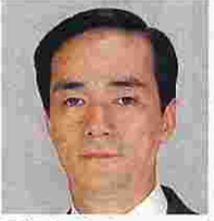
増田信之(ますだのぶゆき) (公明党)