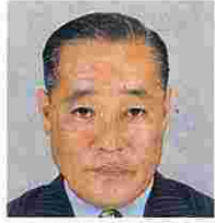
山口 昭(やまぐちあきら) (自由民主党)