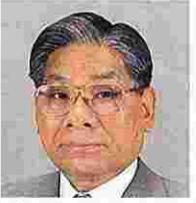
広島文武(ひろしまふみたけ) (自由民主党)