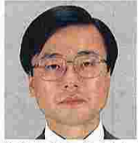
中嶋義雄(なかじまよしお) (公明党)