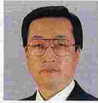
市川康憲(いちかわやすのり) (公明党)