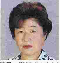
笹尾 淑(ささおとし) (日本共産党)