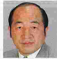
石井徳成(いしいとくなり) (自由民主党)