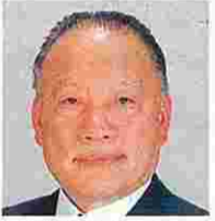
浜中光揚(はまなかこうゆう) (自由民主党)