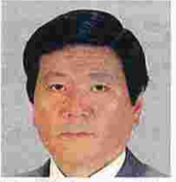
中塚 護(なかつかまさる) (公明党)