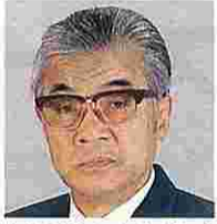
中村大吉(なかむらだいきち) (自由民主党)