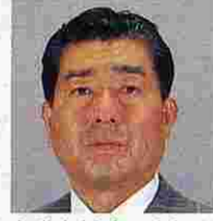
内山武次(うちやまたけじ) (自由民主党)