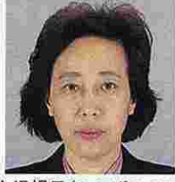
大場暢子(おおばのぶこ) (日本社会党)