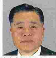
神宮寿夫(じんぐうとしお) (公明党)