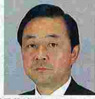
折居俊武(おりいとしたけ) (民社党)