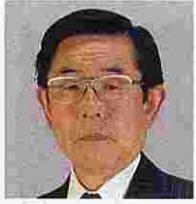
宇田川国一(うだがわくにいち) (自由民主党)