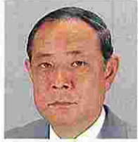
長谷川義樹(はせがわよしき) (公明党)