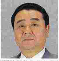
甲斐円治郎(かいえんじろう) (公明党)