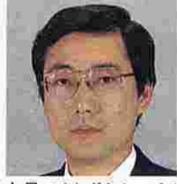
鈴木昌二(すずきしょうじ) (自由民主党)