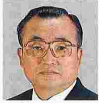
平山八郎(ひらやまちろう) (自由民主党)