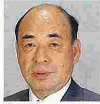
内藤義雄(ないとうよしお) (自由民主党)