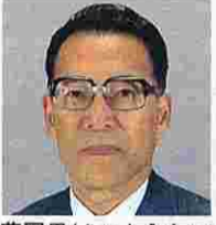
斉藤国男(さいとくにお) (日本社会党)