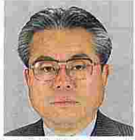
三井勝雄(みついかつお) (日本共産党)