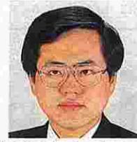
真鍋欣之(まなべよしゆき) (自由民主党)