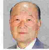
土橋 賀(どばよしお) (自由民主党)