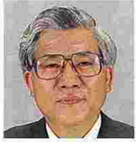
山田武士(やまだたけし) (日本社会党)