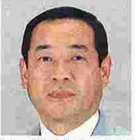
西村 孝(にしむらたかし) (日本社会党)