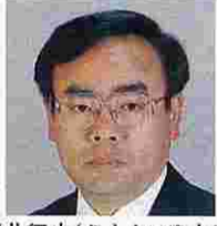
桜井征夫(さくらいゆきお) (日本社会党)