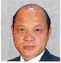
吉本保寿(よしもとやすひさ) (公明党)