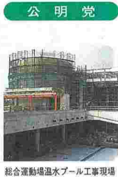
総合運動場温水プール工事現場

入も検討するなど、安全で快適なまちの実現をめざしていく。 質問 公共施設へ雨水貯留槽を設置し、雨水の利用促進に取り組み。地下水のかん養を図るため、道路の雨水マスや雨水管は透水性のものに換えよ。生態系に合わない多摩川へのサケの放流は、環境教育として不適切だ。実際に生息する動植物を教材にしてはどうか。 教育長 生活環境・建設部長 今後とも、雨水の貯留、浸透などに積極的に取り組んでいく。自然環境保護の学習に役立てていきたい。 質問 特養ホームの建設用地の取得には、莫大な費用がかかる。学校などへの合築も含め、小規模特養ホームの整備を検討せよ。国に助成も求めよ。高齢者同士が共に生活する「グループホーム」を、地域と協力して設けよ。また、区民施設利用者が払う、光熱水費一部負担金の収納方法の改善を望む。 助役 高齢対策部長 引き続き国や都に働きかけていく。区民相互の支え合いを推進する。