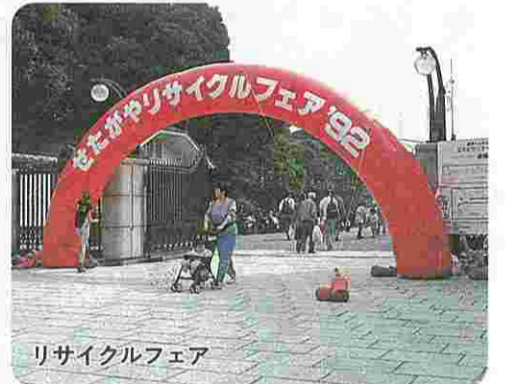
リサイクルフェア

質問 区を取り巻く経済情勢が非常に厳しい。的確な財政見直しのもと、計画事業を着実に推進せよ。また、三軒茶屋再開発ビル最上階への区民が憩える施設の設定、文学館用の土地と建物の買い取り、小田急線複々線・立体化の早期実現を要望する。 区長 財源確保と積極的で柔軟な財政運営に努め、事業の実現をめざす。