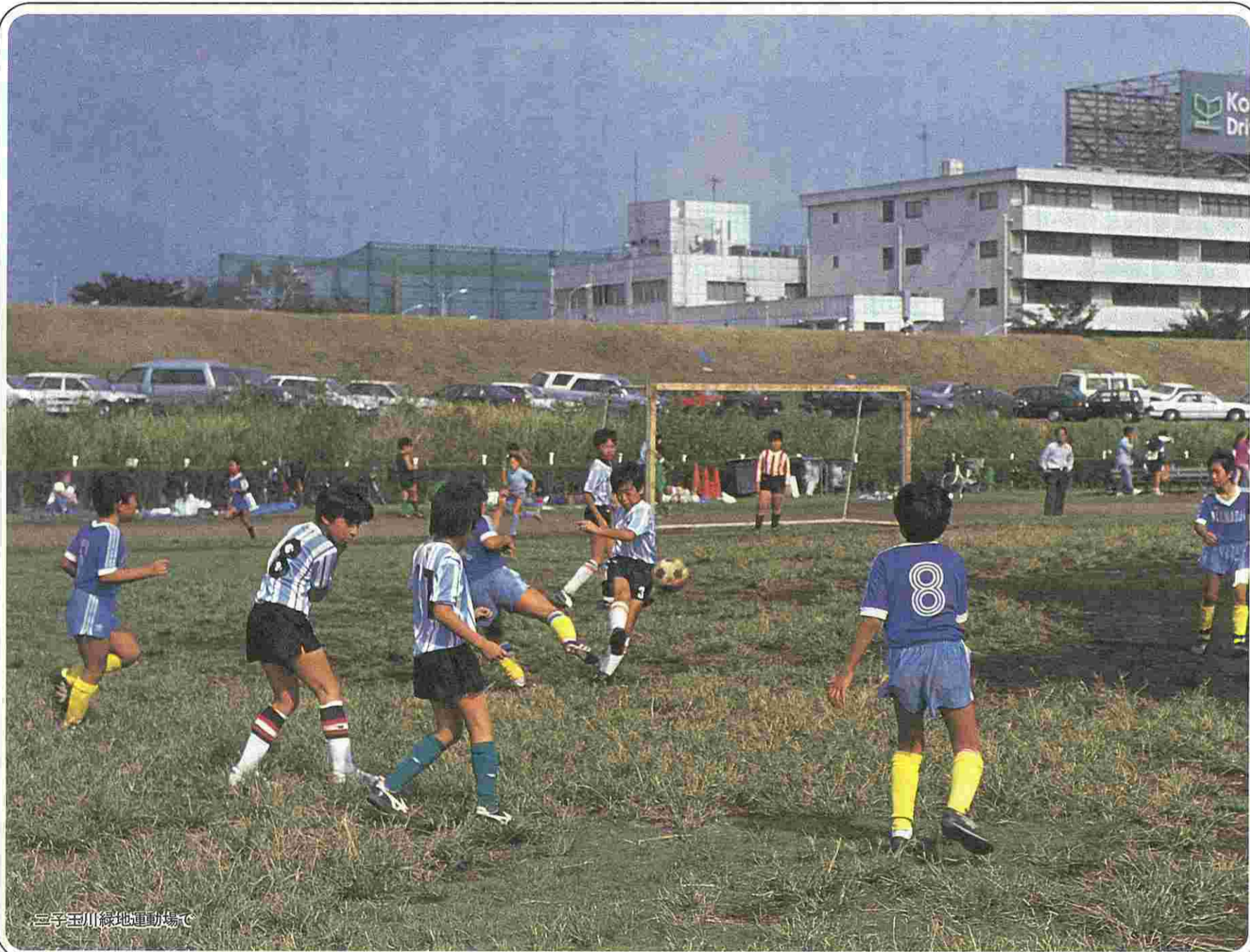
三子玉川緑地運動場で

発行 平成4年10月28日 〒154 世田谷区世田谷4丁目21-27 世田谷区議会議事事務局 ☎(5432)1111 事務局長 津吹 金一郎