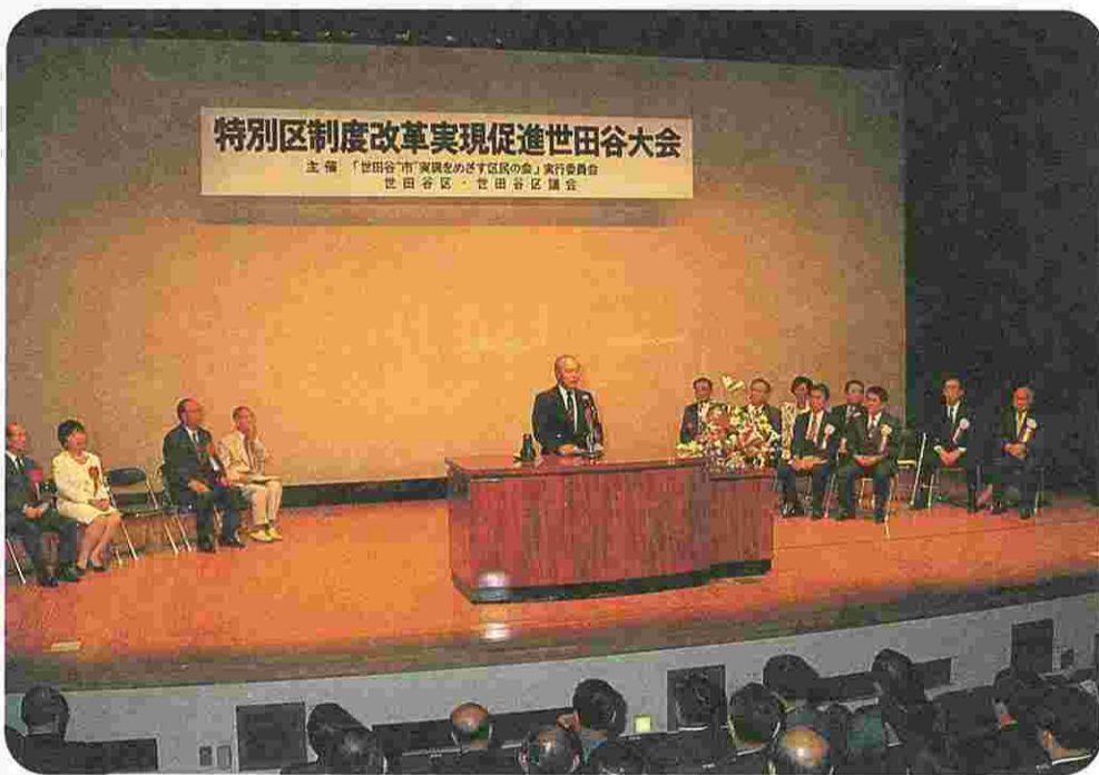
9月27日(日)に烏山区民センターホールで、「特別区制度改革実現促進世田谷大会」が開催されました。

殺菌消毒剤の過剰使用の防止にも努めよ。また、都などへ小田急線連続立体化の環境影響調査のやり直しを求めるよう要望する。