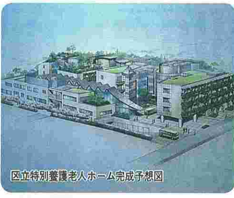
区立特別養護老人ホーム完成予想図

P.Rしていく。融資利率の引き下げや、期間の延長などに努める。 質問 老人保健福祉計画は、区民参加のもとで策定せよ。高齢者の実態を把握するため、職員による訪問調査も行え。また、医療機関の協力を得て、在宅ケアを支える老人保健施設の建設に取り組め。 助役 高齢者のニーズを的確にとらえ、長期的な視点に立って策定作業を進める。老人保健施設は、検討していきたい。 質問 三軒茶屋第2工区の再開発に伴い、地価の高騰や大型店の進出が予測される。