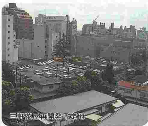
三軒茶屋再開発予定地

初日の本会議で、4人の議員がそれぞれの会派を代表して質問を行いました。その要旨をお伝えします。