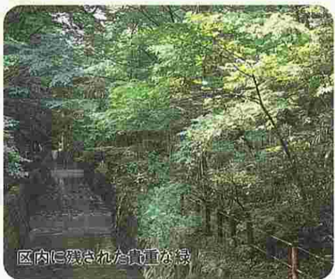
区内に残された貴重な緑

進せよ。ファミリー層への家賃補助も考えよ。また、公有地の活用も検討せよ。 区長 助役 都市整備部長 早期策定に努めている。併設の基準の設定や良質な民間賃貸住宅の誘導など、多様な手法により積極的な供給を図りたい。国など、関係機関に要望していきたい。 質問 高齢化社会の進展に対応した高齢者施設の増設が求められている。各地域の実情にあわせ、バランス良く整備せよ。 助役 高齢対策室長 土地の有効利用を図りながら、計画的な整備に努めたい。 質問 出生率の低下が著しい。安心して子どもを産み育てられる環境の整備に全力をあげよ。 区長 住環境の整備や保育施策の充実など、総合的な取り組みを進めたい。