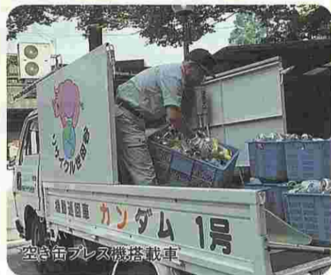
空き缶プレス機搭載車

助役 就労の場の拡大や区民の意識啓発を図るなど、積極的に事業を展開していく。導入を検討していきたい。