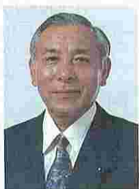
副議長 おぐち 義晴 57歳 公明