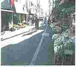
松陰神社通り商店街