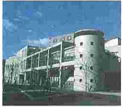
知的障害者就労支援センター すきっぷ