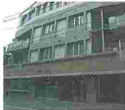
老人保健施設 ビバ・フローラ