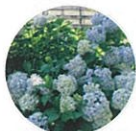
アジサイ (5~7月 開花)

仙川沿いやふれあい遊歩道の桜をはじめ、桐の木やケヤキ並木など、草花や高木まで様々な自然に囲まれています。仙川沿いでは野鳥を観察できるなど、豊かな自然の恵みを感じながら散歩できる心地いいエリアです。