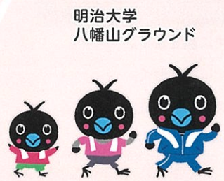
明治大学 八幡山グラウンド

日本で初めての雑誌図書館。評論家・大宅壮一(1900~1970)の雑誌コレクションを引き継ぎ、明治時代以降の雑誌を所蔵しています。※入館料が必要